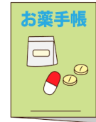
⑤ お薬手帳 (持っている方)